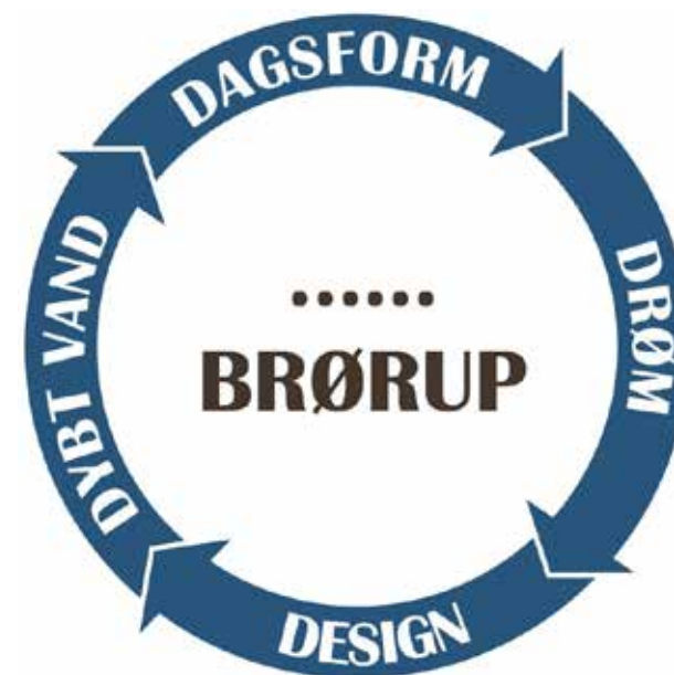
Fig. 1. Brørups 4D-cyklus

Cyklussen roterer om det positive ved et bestemt emne, anført i cirkelens midten, her beskrevet ved Brørup by.